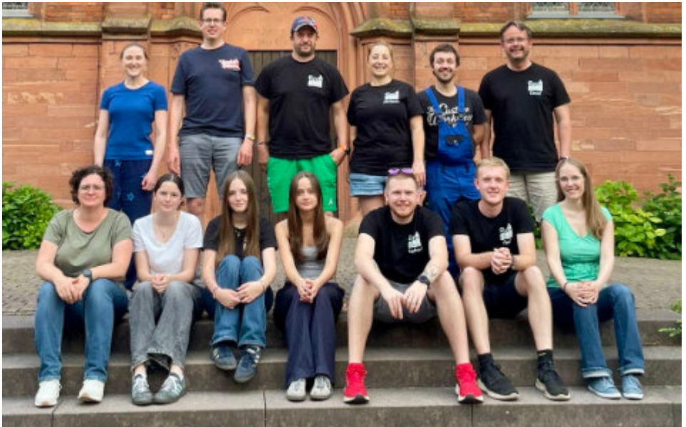
Wir stellen diesmal vor: das Team von Rock at Church

Der Posaunenchor probt bis Ende April Freitags von 19.30 Uhr bis 21.30 Uhr in der Merian-Realschule.